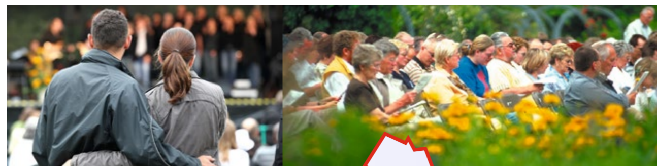
Seit der Reformationszeit gibt es in Westfalen traditionell evangelisch geprägte Regionen wie etwa das Siegerland oder Ostwestfalen. Das Münsterland oder Paderborner Land dagegen sind eher katholische Gebiete. Die jeweiligen Konfessionsanteile haben sich jedoch in den vergangenen Jahrzehnten immer mehr angeglichen.

Die Region ist vielfältig: Das dünn besiedelte, landwirtschaftlich geprägte Münsterland grenzt an den Ballungsraum Ruhrgebiet, die flache Soester Börde an das bergige Sauerland. Das Landeskirchenamt als Sitz von Leitung und Verwaltung ist in Bielefeld.